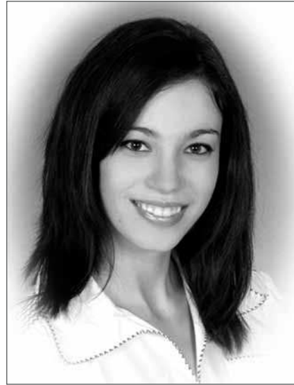
Raska Katalin röplabda