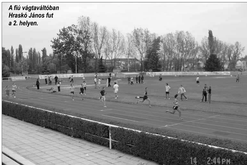
A fiú váltóváltóban Hraskó János fut a 2. helyen.