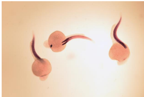
vad fenotípusú embriók

Egyetlen értéket írjon csak, ne intervallumot! ..... 1000-1600 \mu\text{m} (1 pont)